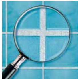
Spárovací hmota Ceresit s recepturou MicroProtect