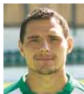
Josef Jindřišek 4 14. 2. 1981 obránce 83 kg, 178 cm