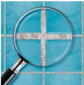
Běžná spárovací hmota

Spáry zůstanou čisté a krásné na opravdu dlouhou dobu!