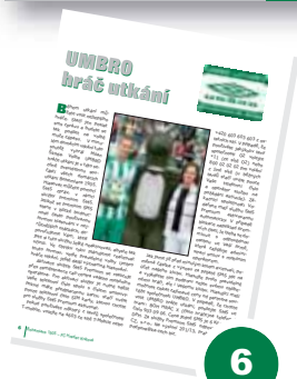
Antonín Panenka Prezident Bohemians 1905

Teď už můžeme jen doufat, aby Bohemka ve vybrané společnosti zůstala co nejdéle. Třeba jako v našich letech, kdy se postoupilo v roce 1973 a vydrželo se v nejvyšší soutěži přes dvacet let. To by pro současnou generaci mohlo být dostatečnou motivací. Věřím, že na to Bohemka má.