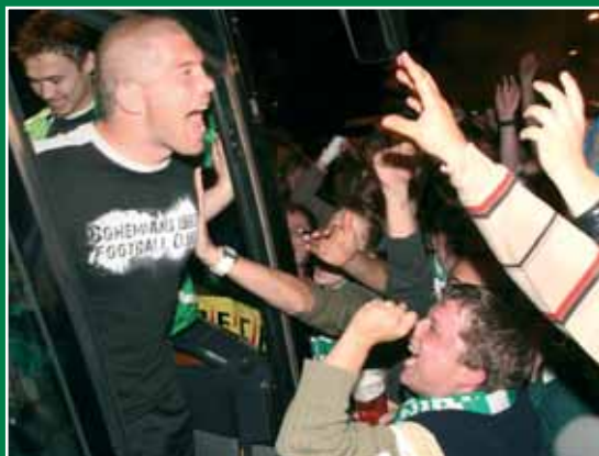
0:17 – příjezd do Ďolíčku