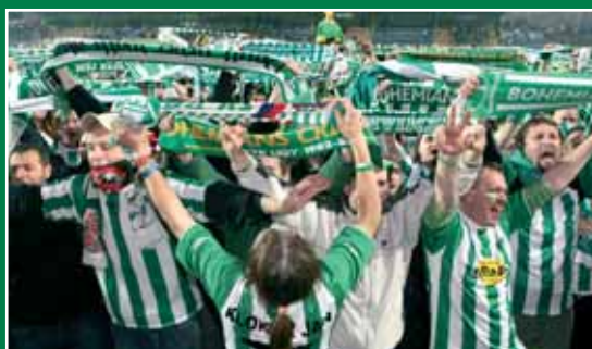
21:00 – radost fanoušků a v kabině