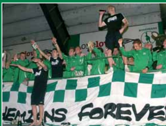
1:30 – Ďolíček slaví