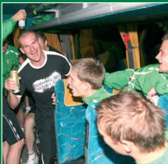
22:30 – cesta do Prahy