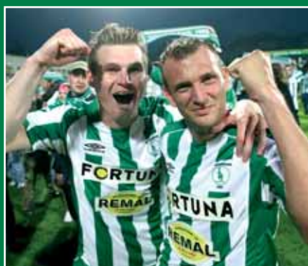
20:49 – konec zápasu, postupujeme